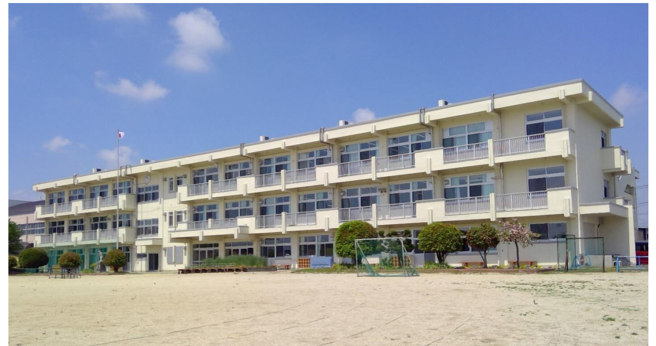
令和7年度 児童数 (令和7年5月現在)