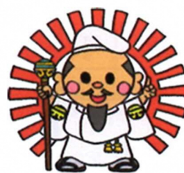
「そうじゃの神」 (元小キャラクター)