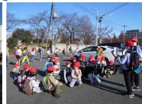
■「かるたの里めぐり」