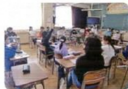
話し合い活動を取り入れた授業の取り組み