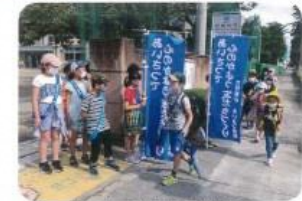
あいさつ運動の取り組み