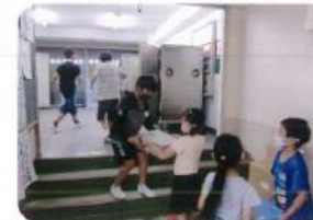
自治意識を高める委員会活動の取り組み