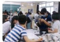
体験的な活動を取り入れた取り組み