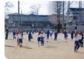
体力の向上を図る運動の取り組み