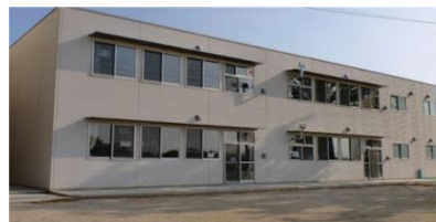
南校舎増築 工事完了