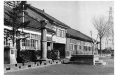
校舎の全景 昭和32年