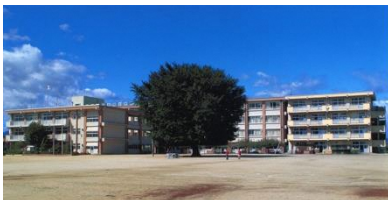
校舎大規模 改造工事完了

一 赤城のふもと 野は広く 桃くれないに 梨みのる このうるわしきふるさとの 友と手を組み 六年を 道ひとすじに 行くところ 永明 永明 われらの永明小学校 二 牛鳴く岡に 雲白く 工場の影 はるかなる 日に進みゆく 文明を 清き自然の ただ中に 知恵かがやきて 澄むところ 永明 永明 われらの永明小学校 三 桃の木川は たゆみなく いま海原をめざしゆく みなたくましく身をきたえ 明日の日本を 築かんと 夢はてしなく わくところ 永明 永明 われらの永明小学校