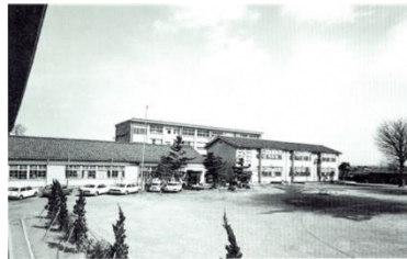
鉄筋コンクリート造4階建ての新校舎完成(昭和48年)