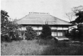
大島学校があった来迎寺