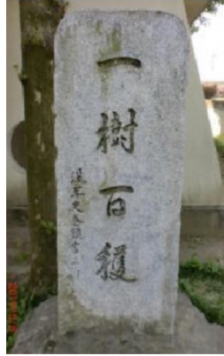
「一樹百穫」の教育理念の碑