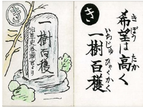
永明小学校の教育 創立 152年