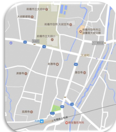
上毛電気鉄道「大胡駅」下車徒歩5分

本校は明治6年10月開校、創立154年目を迎えた歴史と伝統のある学校です。平成16年4月に児童数千人を超え、新設された大胡東小学校に330名程の児童を送り出しました。その後児童数は年々減少傾向にあり、2026年度は、347名でスタートしました。新校舎の建設は、平成17年10月に始まり、平成19年2月に完成しました。校歌に歌われている校庭の大樹は、周囲が10m、樹高20m以上あり、子どもたちに親しまれています。四季を通して、木のまわりで遊ぶ子どもの姿が多く、学校のシンボルツリーとなっています。陸上競技等の運動が盛んであると同時に、俳句や詩の創作活動も伝統的な取組となっています。また、創立43周年を迎える「けやき合唱団」の歌声も大変すばらしく、地域行事やコンクールなどで、多くの方に親しまれています。