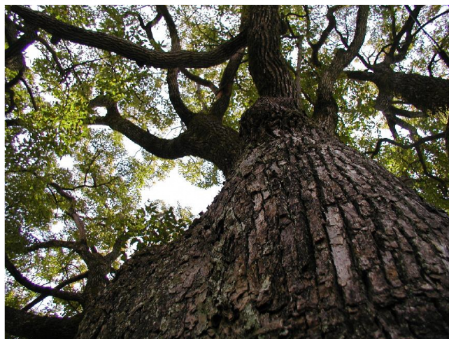
シンボルツリー “くすのき”