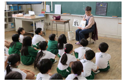
ボランティアによる読み聞かせ