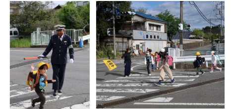
登校の見守り（交通指導員、保護者等）