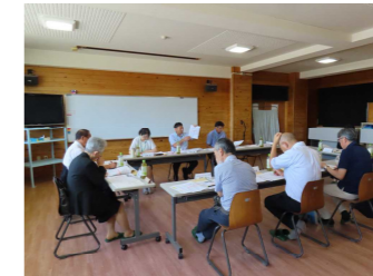
学校運営協議会の様子

本年度も、学校と地域が対等なパートナーとして手を取り合い、それぞれの強みを活かしながら協働することで、子供たちの豊かな学びと健やかな成長を社会全体で支えてまいります。引き続き、皆様の参画とご支援をお願い申し上げます。