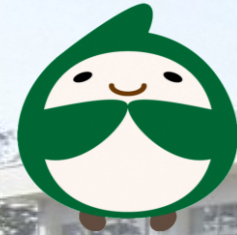
マスコットキャラクター しらかわくん