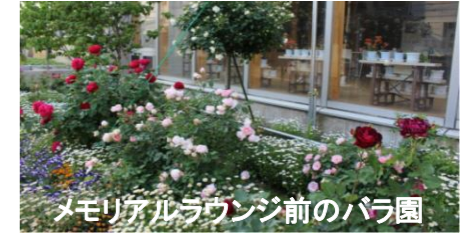
メモリアルラウンジ前のバラ園