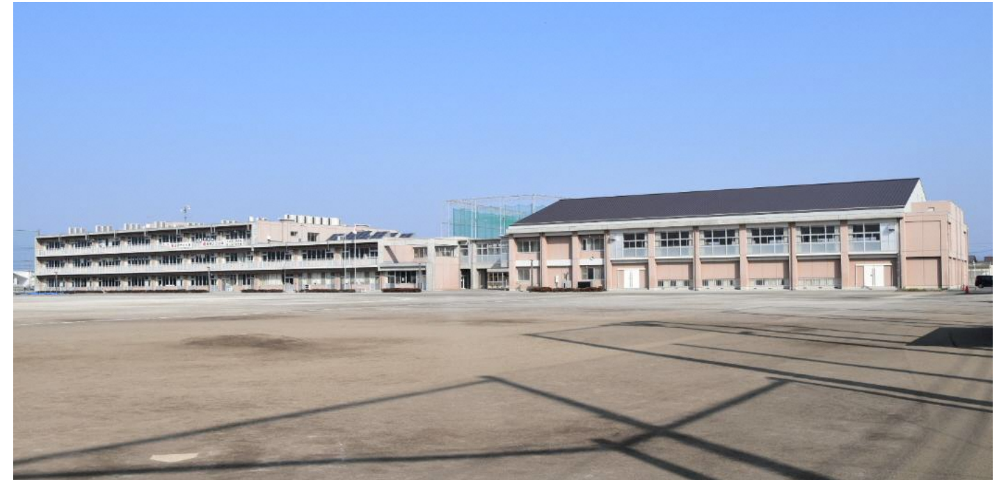
令和8年度 前橋市立第七中学校 校舎・教室配置図