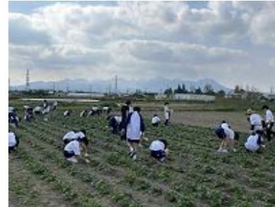
じゃがいもの芽かき