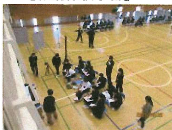
事業所の方のお話