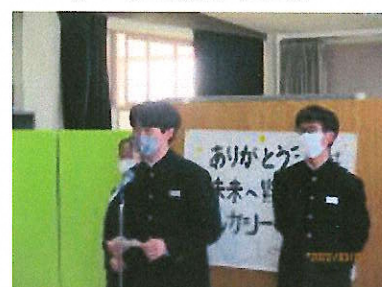
3年生の思いを引き継ぎます!