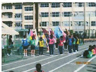
クラス旗の下、心を一つに