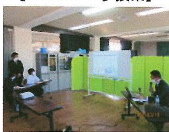
地域の職業人を招いての講話