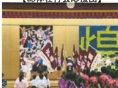
そばにいらなくても心は一つ