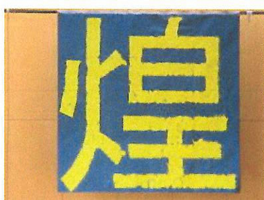
全生徒の手形で一文字制作