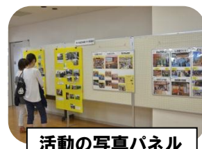
活動の写真パネル