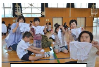
絞りが出来ました

土曜ひろばで絞り染めを体験しました。ハンカチの絞り染めできれいな青色に白い不思議な模様が浮かびました。これを短冊状に縫い合わせ、天の川をイメージした七夕飾りが弁天通りに飾られました。