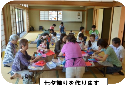
七夕飾りを作ります

子育てひろば”ぽかぽか”が年10回開催されます。ひろばでは絵本の読み聞かせ、手作りおもちゃ作りなど、皆で楽しい時間を過ごす中で、子育て情報の交換などお母さん同士の交流を深めて行きたいと思ひます。