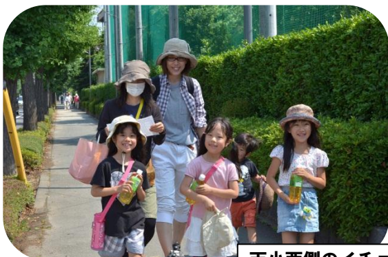
天小西側のイチョウ並木

体育館では、血圧測定、体脂肪測定・血管年齢測定、ピンシャン体操など健康チェックが行われ、参加した皆さん、改めて健康管理を意識した生活が必要と実感していました。