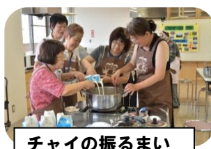
チャイの振るまい

7月21日(日)開催の地域づくり交流フェスタに参加しました。フェスタでは、各協議会が日頃の活動をパネルや体験で発表し地域間の交流を深めました。