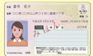
現在お持ちの マイナンバーカード