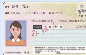
代理人の本人確認書類