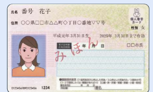
本人の マイナンバーカード