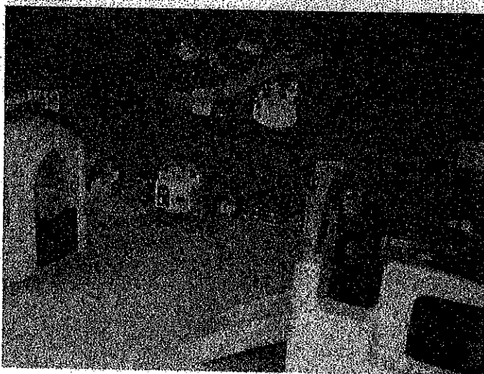
2階 視聴覚室兼乳幼児