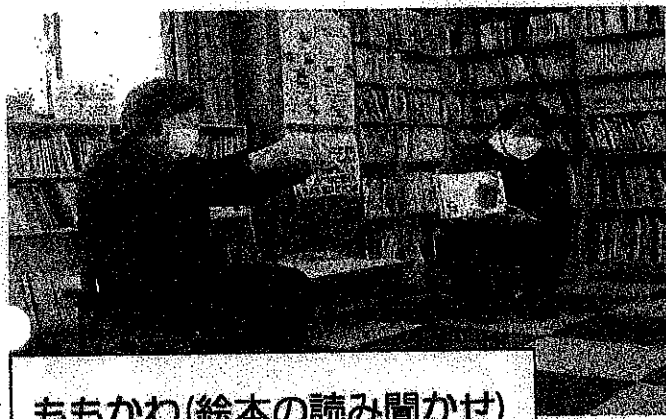
ももかわ(絵本の読み聞かせ)