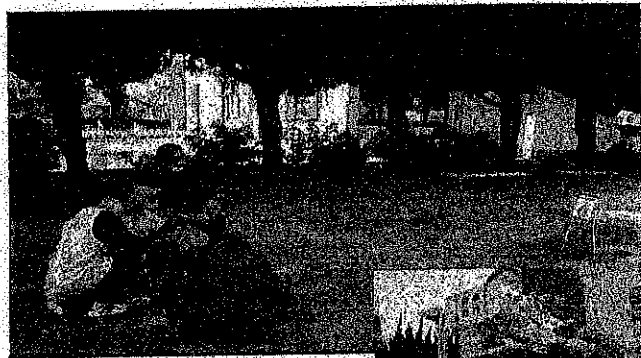
防火教室・避難訓練