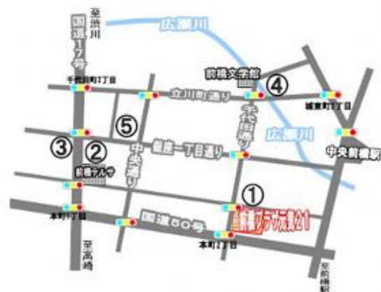
前橋プラザ元気21利用者駐車場