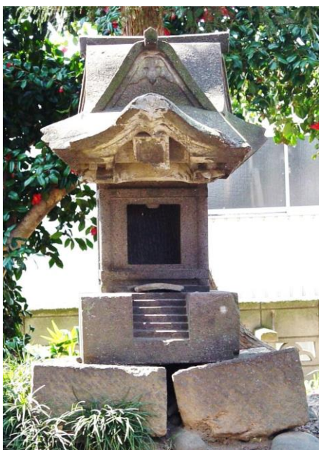
大山信仰の阿夫利社

近戸神社境内に、唐破風入母屋造で文化六年（一八〇九）造立の石殿がある。社額からは社号は読み取れないが、「阿夫利社」と伝承されている。阿夫利社の本源は神奈川県伊勢原市内で「相模の大山」として、古来より山岳神道の聖地として信仰されている。 天平勝宝四年（七五二）、良弁僧正が不動堂を建立し神仏習合され「雨降山大山寺」と号し仏教系の霊場となった。その後、源頼朝は社領を寄進し、徳川家光は巨費を献じて社殿を改築した。相模の大山はもともと雨が降ることを乞い願う霊場で、雨降山ともよばれていた。江戸時代には雨乞いのための農民の講が各地に多く成立し篤い信仰を受けるようになった。 慶応四年（一八六八）、明治政府が目指す国家神道政策により「神仏判然令」が発せられ、神仏が分離され境内の不動堂などの仏教系の施設は破棄された。そしてこの霊場は「大山阿夫利神社」と改称され神道化が謀られた。この石殿も「阿夫利社」と改称された。 内田憲治（荒砥史談会）