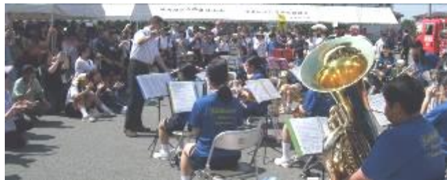
会場が一気に盛り上がった！さすが荒砥中吹奏楽部♪