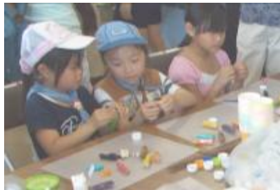
「できた？」上手に完成！