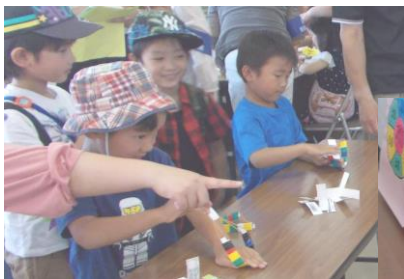
うまく的に当たるかな？

そして、来場してくれたみなさん、どうもありがとう！また公民館と図書館に遊びに来てくださいね。