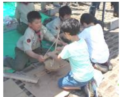
ボーイスカウトで火おこし体験。むずかしい〜