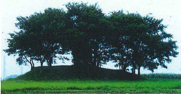
県指定史跡の荒砥富士山古墳