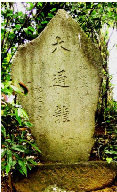
水神信仰の大通龍碑

吹地寮(正法院境外施設)裏手のやや小高い所に「大通龍」と刻字された石碑がある。左に「吹地組」(だいつうりゅう)と刻まれている。今から八十七年前の昭和になってから吹地の人達によって建てられたものである。龍とはインドで蛇が神格化されたもので、角と長い鬚を有する人面蛇身で、大海や地底に住し、雲雨を自在に支配するとされる想像上の動物である。また航海に守護神や雨乞いの神としても信仰されている。なお古代中国では皇帝が権威を誇示するために利用した伝説上の生物である。 吹地集落の東を絶えることなく滔滔と流れる大泉坊川は人々たちから神聖視され、この川には水の精霊である龍が棲んでいるという信仰が生まれた。ある時、吹地に疫病が流行り村人はすっかり疲弊してしまっただ。そんな時、大泉坊川から龍が現れ病を治してくれたという伝承がある。龍がいつも大泉坊川を往き交い吹地の人たちを護って欲しい、という願望から「大通龍」という名称が付けられたのである。毎年四月十六日に祭りが行われている。内田憲治 龍伝説研究会