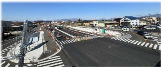
旧今井町東交差点の形状が大きく変わりました