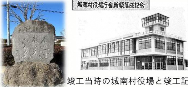
竣工当時の城南村役場と竣工記念碑