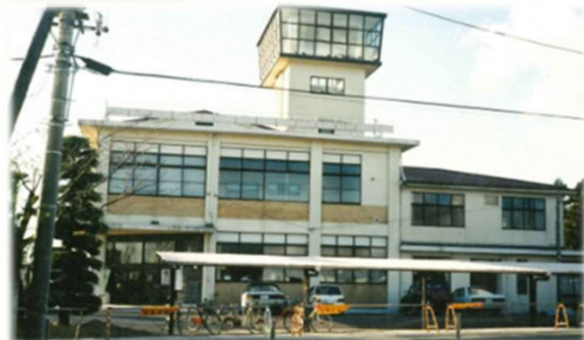
城南支所の1994年当時の姿