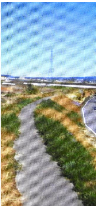
小沢地区の赤城白川

火山活動によって形成され赤城山は多くの伏流水が流れている。赤城白川の水源は大沼からの伏流水で地蔵岳(一六七四)北西麓の谷地を流れる。それは県道四号線(前橋・赤城)と沿うように流れ、赤城南麓広域農道(渋川・前橋・桐生)を通過する。その後は「県畜産試験場」の西方を流れ、国道三五三号(桐生・新潟県柏崎)を通過すると小沢地区へ入る。更に時沢地区と原之郷地区の境界を流れ県道一〇一号線(四ツ塚・原之郷・前橋)と大正用水を過ぎる。上細井町で小暮地区の県畜産試験場南より流れる観音川が落水する。県道七六号線(前橋・西久保)を過ぎると北代田町と下細井町の境界を流れ桃ノ木川へ落水する。延宝九年(一六八一)、酒井忠挙は前橋藩十五万石の五代藩主として家督を継いだ。そのうち二万石を弟の忠寛に分与し伊勢崎藩が創設された。なお、後年に赤城白川の伏流水の湧水を促す工事を行い、新田開発をして二万石の増収を得て十五万石を保った。(内田憲治・荒砥史談会)