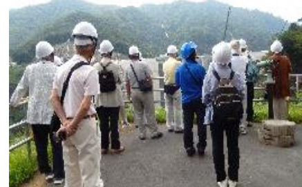
9月3日、ハッ場ダム研修視察を実施