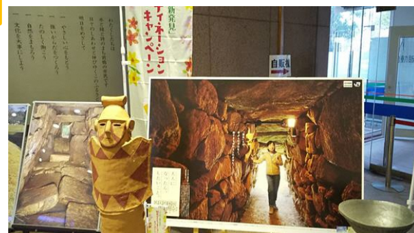
CMには女優の吉永小百合さんが出演。 （撮影場所は大室古墳群） 前橋市役所1階ロビーで展示中

残念ながら本年度企画の「文化財めぐり」は、新型コロナウイルス対策のために余儀なく中止となりましたが、文化財部会は盛り上がっている歴史熱の機運で、皆様が文化財部会へ参加協力してくださることを願っています。