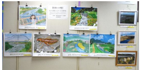
低学年の部・高学年の部・写真の入賞作品 11月10日に賞状伝達式を行いました

小学生対象の「荒砥川こども絵画コンクール」と、中学生以上対象の「荒砥川写真コンクール」を行いました。 夏休みを利用して描かれた子供たちの力作と、日常の風景を撮影した素敵な写真がたくさん応募され、自然環境部会員が真剣に審査を行い、部門ごとに最優秀賞1点と優秀賞2点が選ばれました。残念ながら入賞を逃した皆さんには参加賞をお渡ししました。 この2つのコンクールは、私たちのふるさとの情景を記録し、後世に引き継ぐ活動です。ご応募いただいた皆様に、心より感謝申し上げます。ありがとうございました。