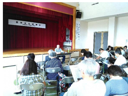
9月29日の歴史文化講演会