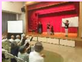
「公民館ボーイズ&ガールズ」の演奏

7 月 22 日「福祉のつどい～いきいき暮らし健康寿命を延ばそう」を開催。 懐かしい歌の演奏や脳の活性化ゲームなどを行い、参加者が大いに笑い、楽しく盛り上がった 1 日でした。