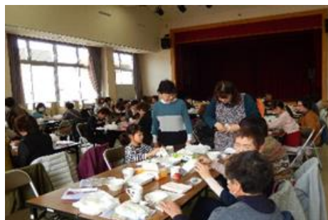
子ども達も大喜び