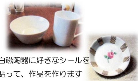
白磁陶器に好きなシールを貼って、作品を作ります

これらは関係皆様のご協力のお蔭であり御礼申し上げます、有難うございました。今後とも部活動にご理解とご協力を宜しくお願い申し上げます。