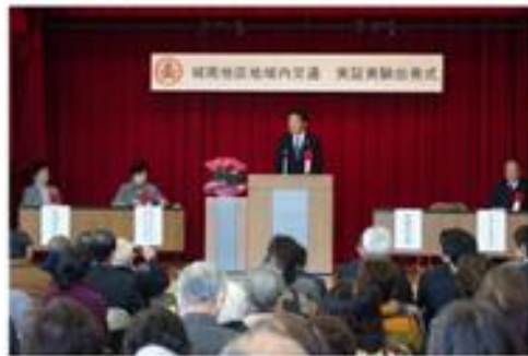
12月13日地域内交通出発式の様子

昨年12月13日から、利用者の動向とAIを取り入れた実証実験が始まり、本年2月末まで実施されました。実験の結果、持続可能な本格運行が開始されるよう、運営委員会では今後も地域の方々と協力し合いながら、努力を重ねていく所存です。