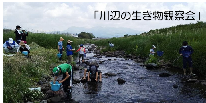
「川辺の生き物観察会」