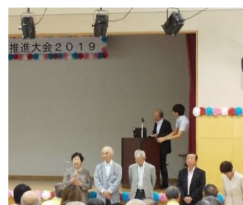
城南地区の発表模様