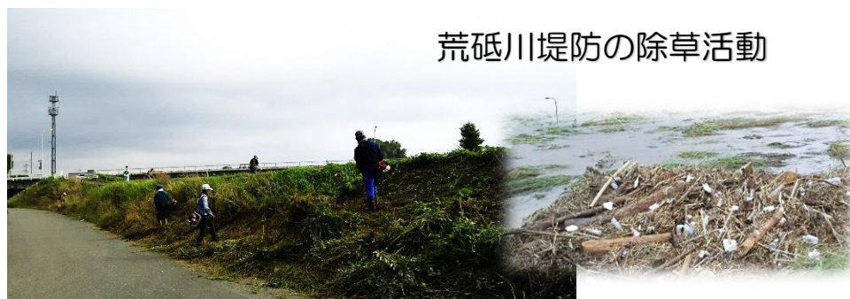
荒砥川堤防の除草活動

5月19日(日)、荒砥川・上荒砥橋近くで実施しました。毎年楽しみに参加してくれているご家族もおられ、慣れない川底で足元に気をつけながら、網を使って上手に川の生き物を採り、生き物の生態をみんなで楽しく学びました。