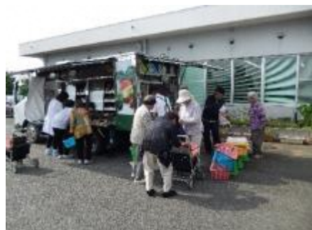
富田町すみれ荘移動販売 R1.6.26