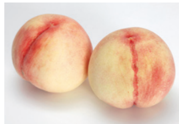
新認証品 青木農園 〔鉢で育てて甘味が凝縮した桃〕

す。経験や資格は問いません。事前申し込みで先着5人まで未就学児の託児ができます。 時 11月11日(木)・12日(金)・18日(木)・19日(金)、9時10分～16時 場 ジョブセンターまえばし 対 自宅で子どもを預かれる人、先着15人 申 11月4日(木)までにファミリー・サポート・センター ☎027・289・3946へ ○特定個人情報保護評価へ意見を 特定個人情報ファイルの取り扱いを記載した特定個人情報保護評価書について、パブリックコメント(意見募集)を実施。寄せられた意見は、本市の考え方と併せて各閲覧場所でご覧いただけます。 時 10月5日(火)～11月4日(木)(土日祝・祝日を除く) 閲覧場所・意見書の配布 市役所情報公開コーナー・市民課・収納課、保健センター内保健総務課新設コロナワクチン接種推進室、各支所・市民サービスセンターで。本市ホームページにも掲載します 意見書の提出 11月4日(木)までに所定の用紙に記入し、各閲覧場所へ直接。または郵送かファクスで。住民基本台帳については市民課(☎02