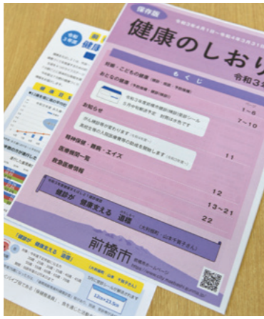
昨年度の最優秀作品

健康診査の受診を啓発する標語を募集。標語は俳句の形に準じた五・七・五調で作成してください。最優秀・優秀作品には賞状と記念品を贈呈。最優秀作品は受診勧奨のチラシなどに掲載します。申し込み方法など詳しくは本市ホームページをご覧ください。