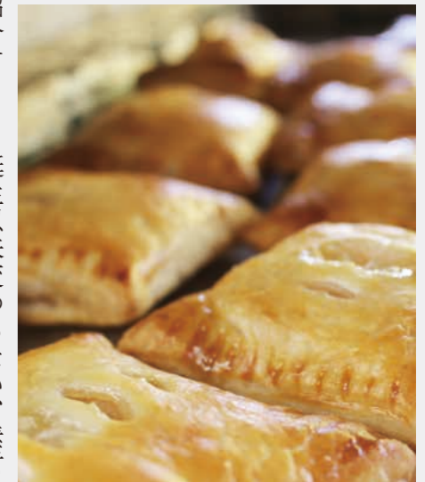
焼きたての特製りんごパイ

旬な農産物や生産者を紹介するこのコーナー。今回は富士見農産物直売所で手作りしている特製りんごパイです。