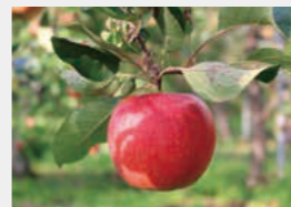
富士見産のりんご