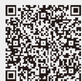
「新樹」はこちらからご覧ください