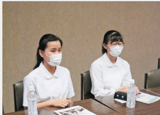
前橋女子高の二人

男女共同参画センターで発行している男女共同参画情報誌「新樹」のコーナーでは、同誌の記事の一部を紹介します。今回は「考えよう!SDGs×ジェンダー平等」です。