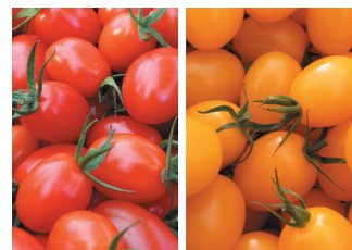
あまえんぼ〜(左)ときかんぼ〜(右)

女子バレーボールV2リーグに所属する群馬銀行グリーンウイングス。2021-22シーズンはレギュラウンドで3年連続第1位の結果を収めました。上位4チームで戦うファイナルステージでは第2位となり、V1リーグとの入替戦に進出。惜敗しV1昇格とはなりませんでしたが、今シーズンも大いに健闘しました。