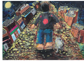
昨年度金賞作品 小学生高学年の部