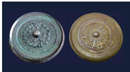
写真左：三角縁神獣鏡(実物) 写真右：抹茶・金粉で飾り付けたチョコレート

☎2月10日(金)10時～12時、14時～16時 場 総社公民館料理実習室 対 18歳以上、先着各8人 ¥1,000円 申 1月12日(木)から文化財保護課へ