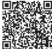
家庭ごみ分別検索