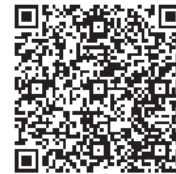
前橋市の取り組み

紙・衣類等、小型家電、インクジェットプリンターカートリッジ、廃食用油は、市内各所にあるリサイクル庫や回収ボックスなどで回収しています。詳しくは問い合わせるか家庭用資源・ごみ分別ガイドブック、前橋市ホームページをご覧ください。