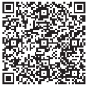
家庭用資源・ごみ分別ガイドブック