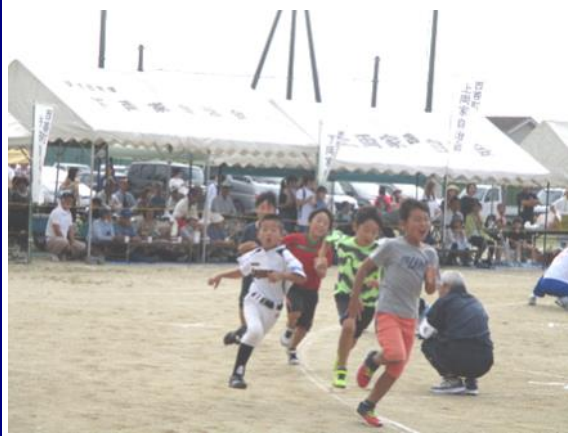
第56回上川淵地区運動会のようす

上川淵地区も、少子高齢化が急速に進んでおりますが、皆様と知恵を出し合い、支え合い、安全で安心して暮らせる街づくりを努めてまいりますので、よろしくご支援、ご協力をお願い申し上げます。