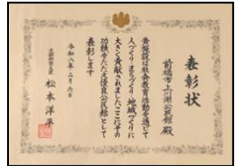
↑いただいた表彰状

上川淵公民館は、このたび優良公民館として文部科学大臣より表彰されました。事業内容や取組の工夫、地域の皆さまの学びへの支援が評価され、全国で60館が選ばれました。