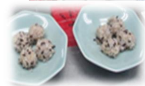
古代米と もち米の シュウマイ

令和7年度は、たまねぎ、じゃがいも、さつまいも、落花生を栽培しました。また、食育の一環として地域の親子を対象に、収穫体験会も開催しました。