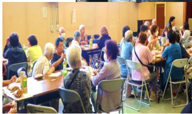
和やかな雰囲気 の茶話会