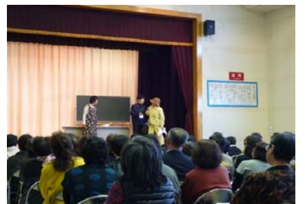
支援者養成講座(11月)