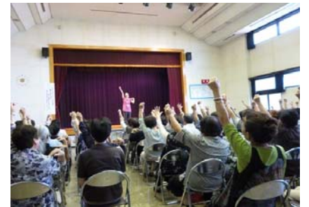
支援者養成講座(9月)