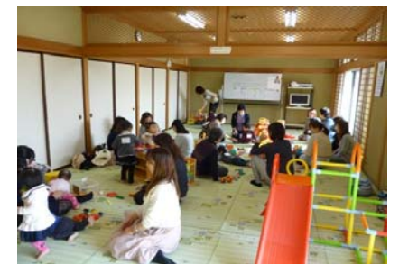
子育てサロンの様子