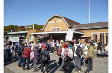
桐生駅にて～これから出発

地域再発見と題し地区内外で史跡や自然観察、文化施設見学などを組み込んだコースを設定することで、ウォーキングに地域独自の要素を盛り込み、子どもから高齢者までが気軽に楽しみながら歩けるようにし、3回のウォーキングを開催しました。また、県立県民健康科学大学の協力をいただき、骨密度検査も開催しました。