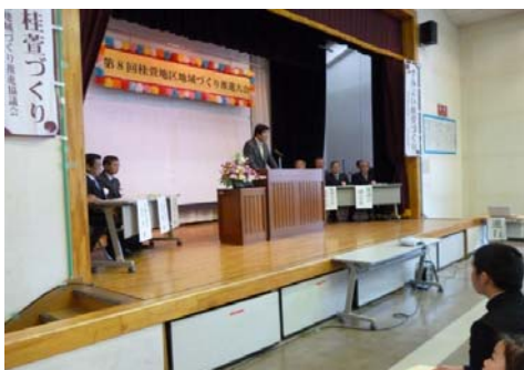
3/8の推進大会には176名の方が参加

地域づくりとは、「安心して、いきいきと暮らせる住みよい地域社会を構築するため、地域住民が主体となって地域課題を解決していく活動や取組み」のことをいいます。 地域とは、一般的にはコミュニティと呼ばれる共同社会、日常生活を営むうえでの繋がり・まとまりとして、隣近所や町から広くは市内全域に至るまで、目的や必要に応じて範囲が変化する空間・広がり・集団を意味することをいいます。