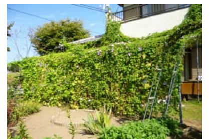
グリーンカーテン 大賞

1位：石関町自治会 2位：萱野団地自治会 3位：東片貝町自治会 1位の石関町自治会には、市長賞が交付されました。 石関町自治会には、推進大会時に活動内容を発表していただきました。