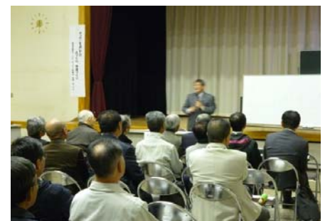
地域づくり講演会