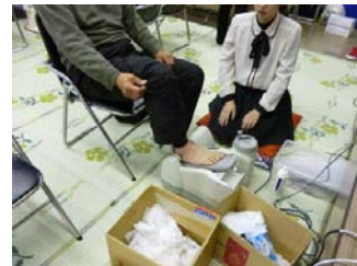
骨密度検査の様子