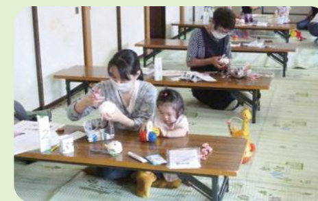
今年度実施の様子

0歳から3歳までの未就園児とその親を対象に、桂萱公民館で開催していますが、今年度は、4月・7月・10月に開催し、11月は「バルーンアート 風船がいろいろな形になるよ」を行いました。その後は新型コロナウイルス感染症のため、中止となりました。 《運営協力者：ボランティア桂萱、民生・児童委員、主任児童委員》