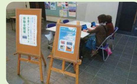
インターネット体験会

主に、市ホームページの閲覧や、市公式Youtube動画に掲載されている桂萱公民館講座の視聴などをメインに行いました。参加者の方からはスマートフォンは所有しているがほとんどインターネットを使用することが無いので、これを機会にもっとインターネットを活用していきたいとの声がありました。