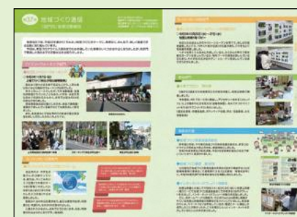
地域づくり通信第37号

公民館及び地域づくり推進協議会を含む4団体で構成する「公民館報桂萱発行委員会」で連携発行する「公民館報 桂萱」442号に、令和3年度各部門の前期活動報告を掲載し発行しました。