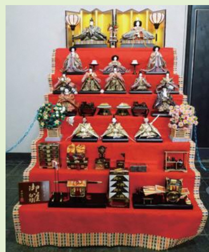
桂萱公民館でのひな人形展示写真