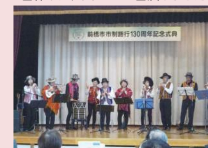
ケーナサークル鳥と風

11月6日(日)前橋市政施行130周年記念式典<桂萱会場>に連協を代表して2団体がアトラクション出演しました。