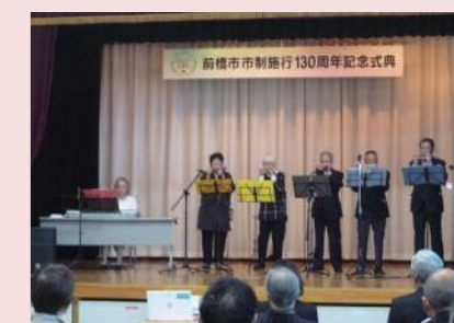
ファミリー・ハーモニカクラブ

発表曲は、人気のある曲を選びました。コロナ禍で発表の機会が減っているので、演奏の機会に恵まれたことに感謝しています。(須田会長)