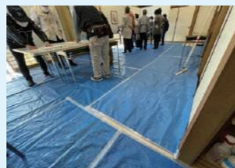
和室には、土足用の青シートを引きます