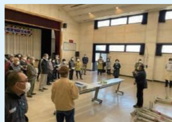
準備の挨拶をする会長