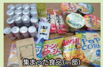
集まった食品(一部)