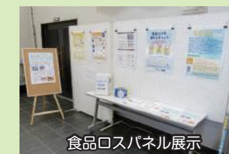
食品ロスパネル展示