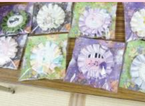
アンデコールロゼット作品