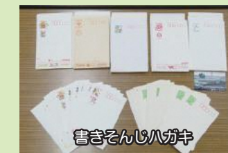
書きそんじハガキ