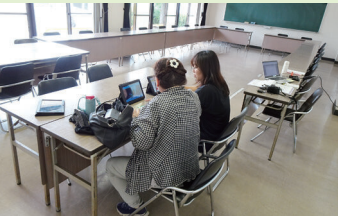
インターネット(タブレット)体験会

また当日は、クールシェアスポットとしても場所を提供し、皆さんにご利用いただきました。