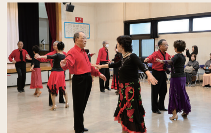
社交ダンス(フロア発表部門)