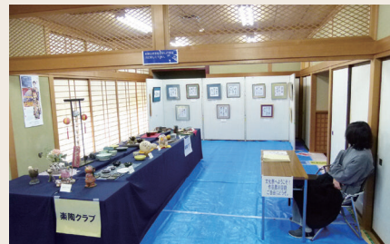
陶磁器展示(作品展示部門)