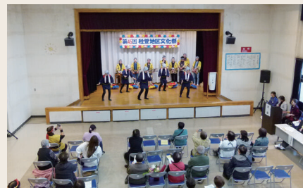
八木節(舞台発表部門)