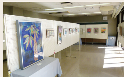
七宝焼展示(作品展示部門)