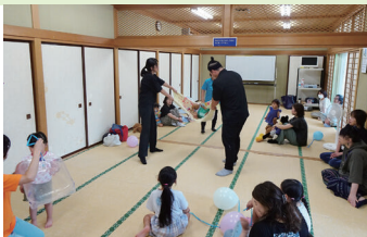
子育てサロンの様子

0歳から3歳までのお子さんと親を対象に、桂萱公民館で開催しました。親子ピクスや手形の作成、ケガの対処法や応急手当法など、様々なメニューにより、親子の絆を深めています。 《運営応援者:民生・児童委員、主任児童委員、保健推進員》