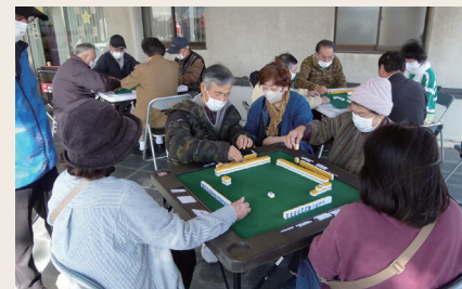
健康マージャン体験(特別部門)