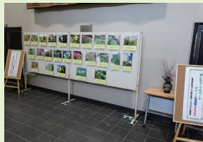
楽しもう!フラワー&グリーン写真展2025

会議やサークル活動などで公民館に訪れた多くの皆さんが作品をご覧になられました。このような活動をきっかけに、さらに環境に優しい活動が広まることを期待します。