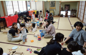
神社de子育てサロンの様子