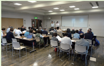
先進地視察研修(越谷市)

9月19日(金)32名の参加をいただき、埼玉県越谷市の「ふれあいサロン・福祉推進員制度」の取り組みや「子育てサロンの開催状況」を視察し、意見交換してきました。今後、地域の福祉活動がより充実し、「すみよい桂萱づくり」に繋がればと思います。