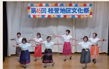
フォークダンス(舞台発表部門)