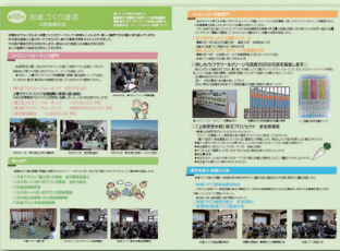
第48号地域づくり通信

公民館及び地域づくり推進協議会を含む4団体で構成する「公民館報桂萱発行委員会」で連携発行する「公民館報 桂萱486号(8月1日発行)」に、令和7年度各部門の事業計画などを掲載し発行しました。