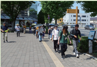
楽しくウォーキング