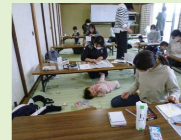
昨年の「子育てサロン」様子