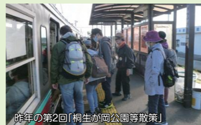
昨年の第2回「桐生が岡公園等散策」