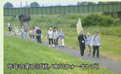
昨年の第1回「桃ノ木川ウォーキング」