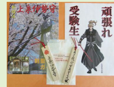
昨年の合格応援「上泉伊勢守木札」