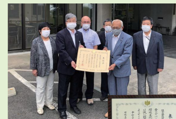
喜楽環境部長(左から2人目)と協議会正副会長

今回は、環境省による表彰式が中止となりましたので、環境大臣に代わって喜楽前橋市環境部長より表彰状の伝達を受けました。