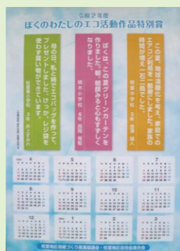
昨年の「エコ活動作品特別賞」ポスター