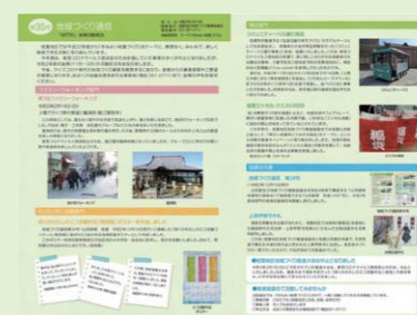
第35号地域づくり通信