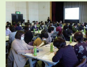
一昨年の「ふれあい・いきいきサロン支援者講座」