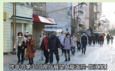
昨年の第3回「県庁展望と龍海院・徳江閣」