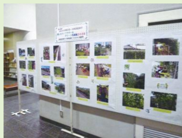
昨年の「楽しもう!フラワー&グリーン写真展」