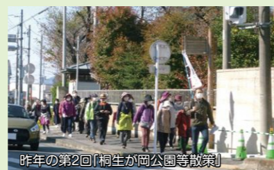
昨年の第2回「桐生が岡公園等散策」