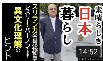
スリランカ名誉総領事 異文化 理解のヒント(下川淵公民館) 14:52