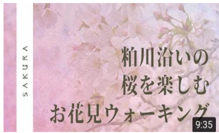
粕川沿いの桜を楽しむ お花見ウォーキング(粕川公民館) 9:35