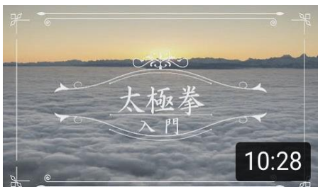
入門太極拳～心と体を癒やして いこう～(東公民館) 10:28