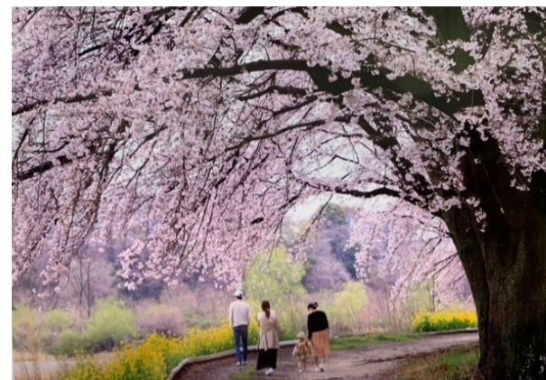
③ 利根川沿いの南町公園を散策する家族