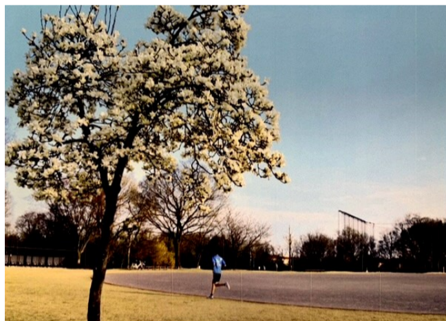
⑦ 大利根緑地のハクモクレン