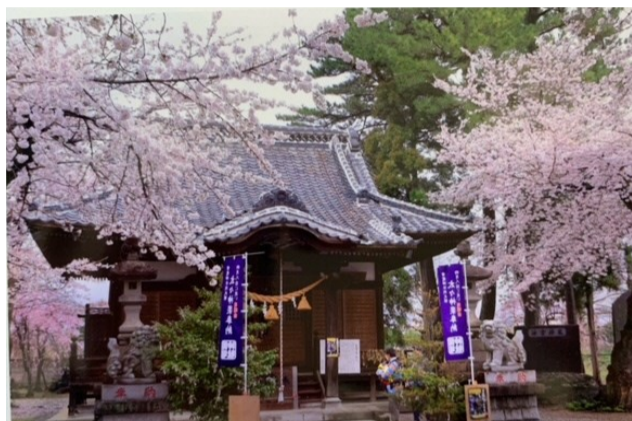
⑤ 雷電神社（上新田町）