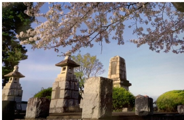
④ あずま林の広場の桜と平和塔