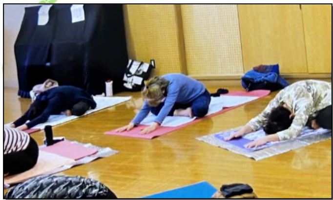
【あずまヨーガ教室】