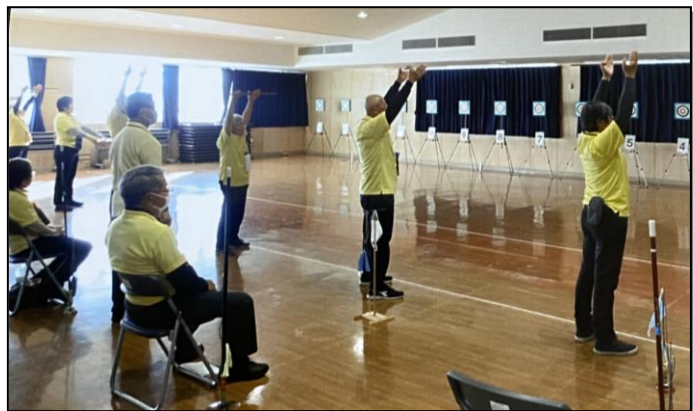
【日本スポーツウエルネス吹矢協会前橋支部】