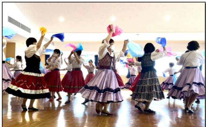
【東フォークダンス愛好会】