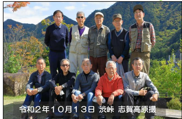
令和2年10月13日 渋峠 志賀高原撮