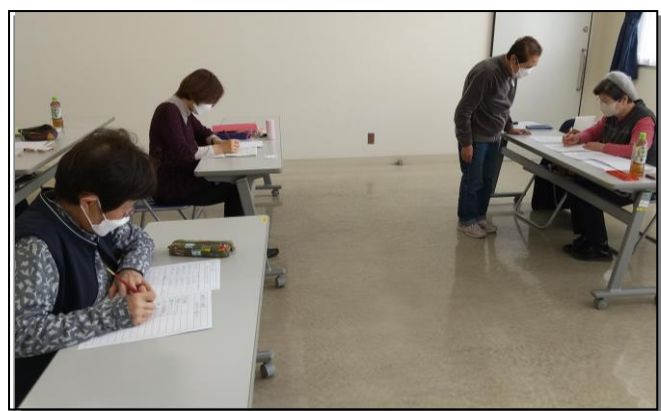
【東ペン習字友の会】