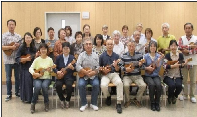
【ウクレレ・アロハ会】