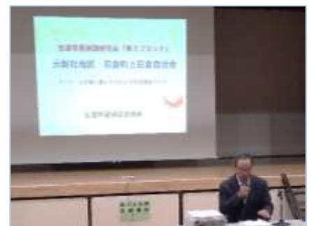
発表を行った7区高津奨励員

今後とも生涯学習活動への取り組みに、地域の多くのみなさまのご支援、ご協力をお願い申し上げます。