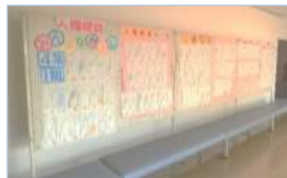
視聴覚室前、ホール前ロビーや廊下など公民館内各所で展示しています。

今年度も、元総社中学校と地区内3小学校のみなさんから、標語や作文などの作品を募集し、多くの作品が集まりました。こちらは現在、元総社公民館ロビーや廊下に展示しています。小学校1年生から中学校3年生まで、各学年のみなさんによる素晴らしい作品が並んでいます。1月31日(木)まで展示していますので、ぜひご覧ください。