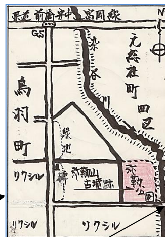
南栄橋(稲掛けの橋)

この弥勒山は、古墳であったといいます。今は、当時の面影はなく、「開墾記念碑」として残るだけですが、その大きさは、高さ8尺(約2.4m)、幅66尺(約20m)、広さ4.13畝(約410㎡)の円墳だったとの記録が残っています。(上毛古墳総覧)