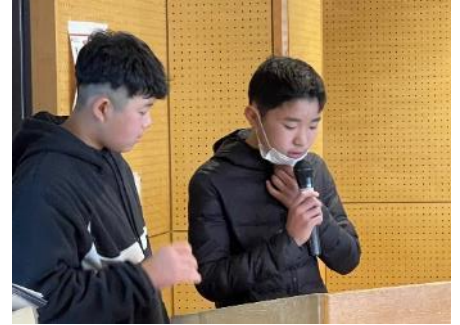
↑11区子ども会の司会のお二人堂々とした司会でした!