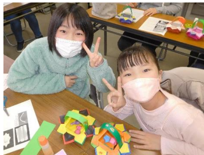
かわいくできたよ！