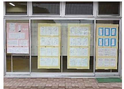
元北小学校・元総社中学校の 作品展示の様子(南側)