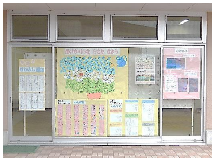
元小・元南小・元北小学校の 作品展示の様子(北側)