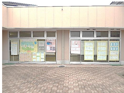
中庭からの 展示全体の様子