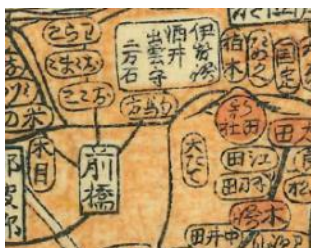
弥次喜多が使った地図？ (嘉永元年諸国細見国郡図)