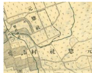
昔は畑ばかりだね！ (大正10年前橋市全図)

※展示品は、所有されている方から許可を得てコピーしたものです。 ※展示品のコピーや借用の申し出はご遠慮ください。