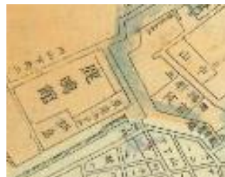
鹿鳴館ってここだったの！ (明治10年東京実測図)